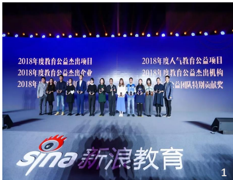
1、2018年度教育公益杰出机构 2、2018年度十大公益项目 3、2018年度公益组织奖

美丽中国支教十周年里，我们收获了一份又一份的鼓励和荣誉。每一份荣誉的背后都离不开社会各界支持者们的关爱和帮助，以及美丽中国人的努力和付出。