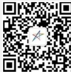
美丽中国官方微信