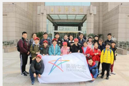
图/在上海博物馆前的合照