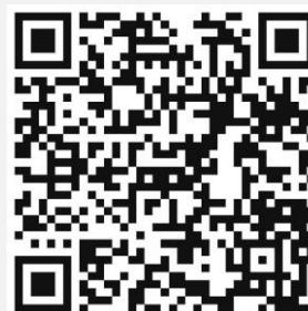
美丽中国月捐二维码

美丽中国支教诚邀您成为“美丽月捐人”，持续的支持能够带来更多的力量，助力改变的发生。