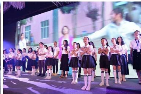
师生合唱美丽中国队歌《远辰微光》