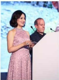
美丽中国支教理事致辞

九层之台，始于累土；千里之行，始于足下；而美丽中国支教的十年，始于一个初心和无数默默支持。2018年11月24日的香港，在近400位美丽中国长期支持者的见证下，美丽中国支教庆祝了自己的10周岁生日。晚宴现场还有来自美丽中国广东梅州梓里学校的学生们、全国各地的校园大使们、云南、广东、广西、甘肃、福建的项目老师们和校友们，共同庆祝这意义非凡的十年。现场也获得了来自众多客人的捐赠，这些爱心，将帮助美丽中国招募更多优秀青年，为乡村孩子们带去更多人生可能！