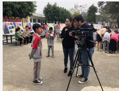
图/小画家接受采访