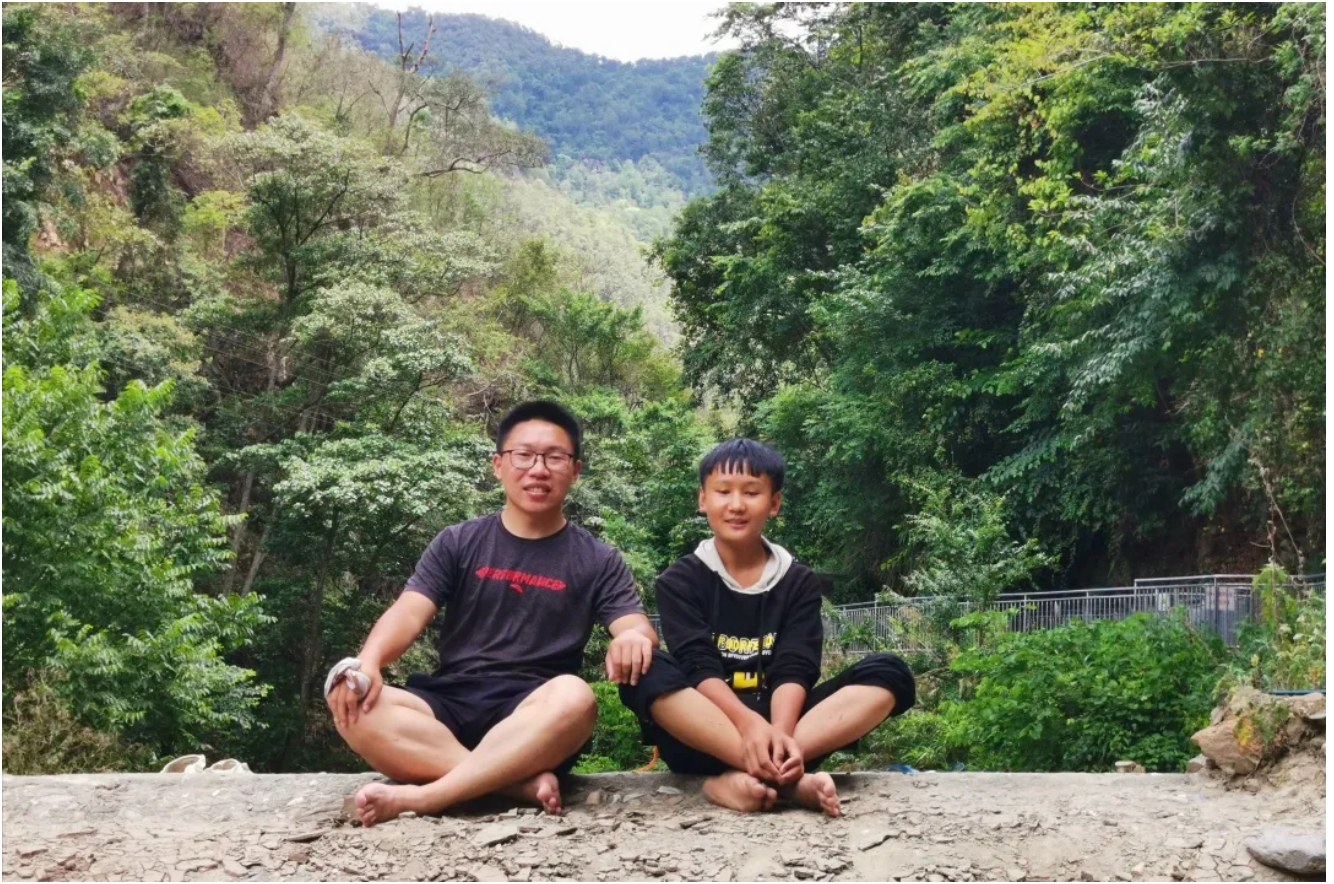
陈老师到达孩子家中

与学生失去了联系。所幸最终靠着问路以及手机断断续续的微弱信号，我还是来到学生家里，不过这已经是好几个小时之后的事情了，其间种种艰辛与尴尬，一言难尽。