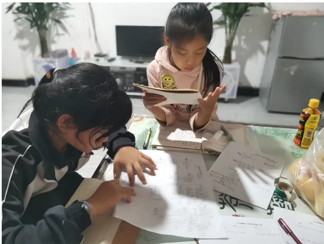
在家里写作业的孩子们

和对家访的感受，思考家访的意义。探讨中，我们一度觉得，家访对于项目老师的成长作用甚至大于对孩子。对于孩子来说，除了老师到来的一时喜悦，家访并没有带来什么实质上的改变：贫穷的依然贫穷；「成绩差」的依然「成绩差」；「问题学生」、「问题家庭」依然充满问题——似乎什么也没有改变。就在这样困惑当中，我送走了三位前辈，迎来了两位新的同伴，开启了第三季的支教生活。