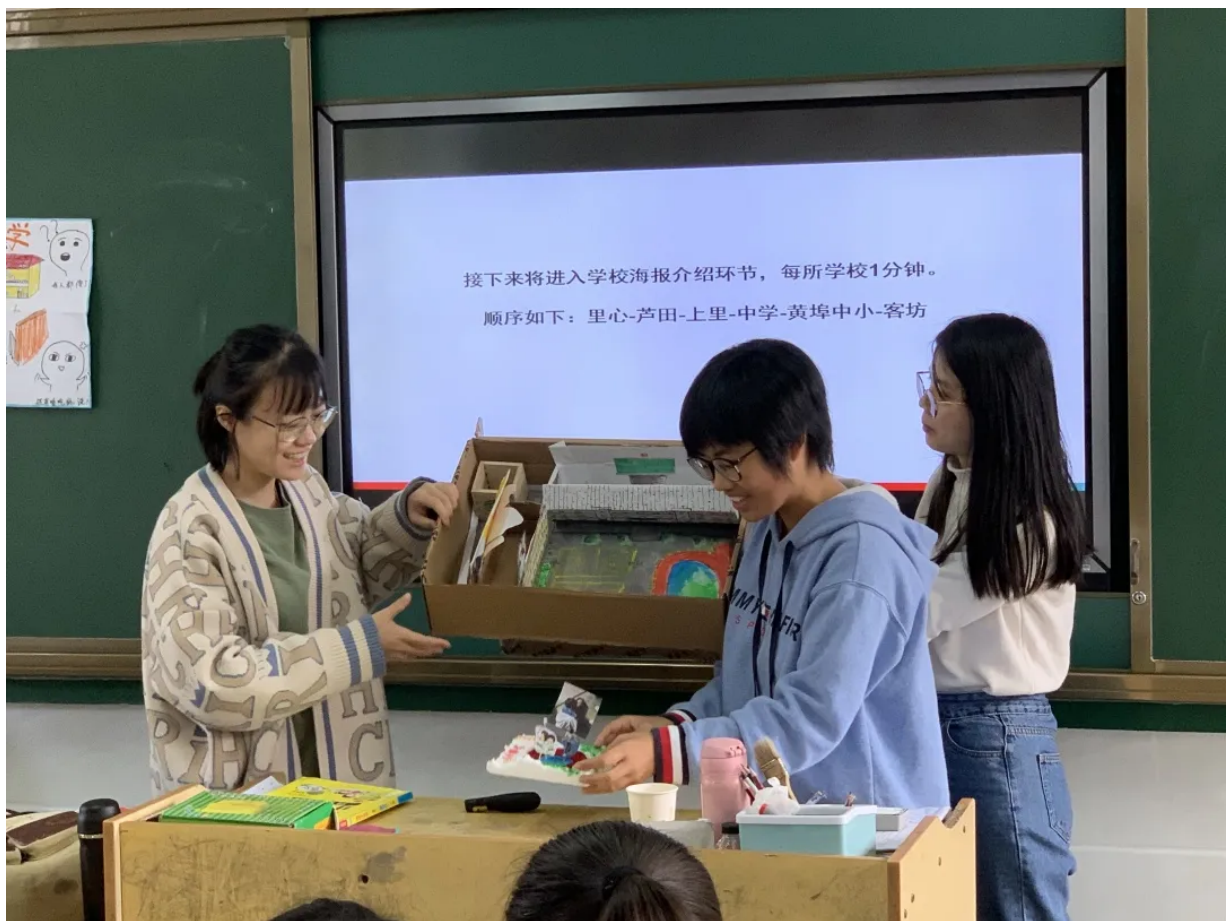
福建三明片区活动照片

福建三明地区的中期培训安排了1个课程，2场分享会，1个活动。1个课程是指“课堂提问-实操课”，2场分享会包括了“特殊教育分享”和“支教老师的心理调适”，1个活动是指教研活动方案讨论，通过这些课程和活动，希望能提升项目老师的教育教学能力、职业发展能力、促进团队融合和文化遗产。