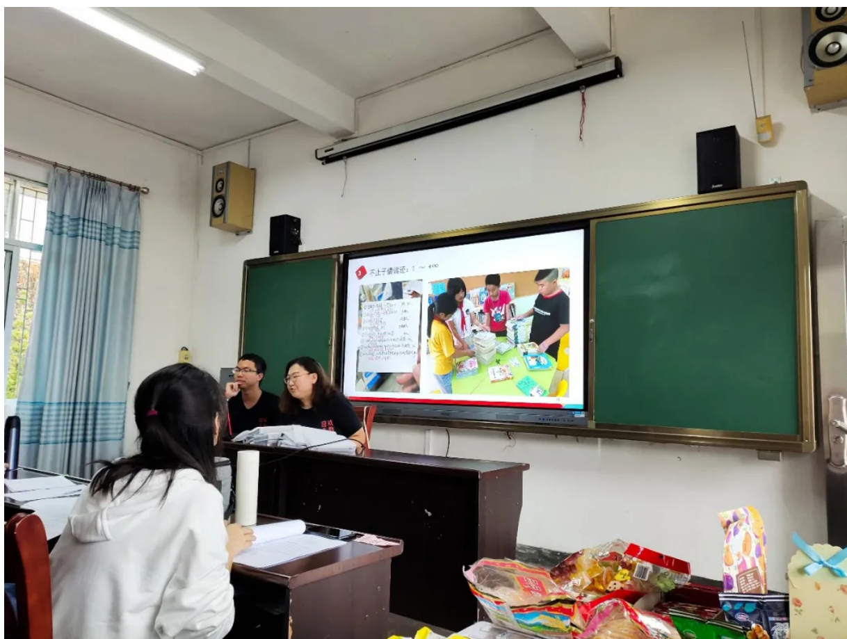
三乡中学项目老师分享“三乡项目”