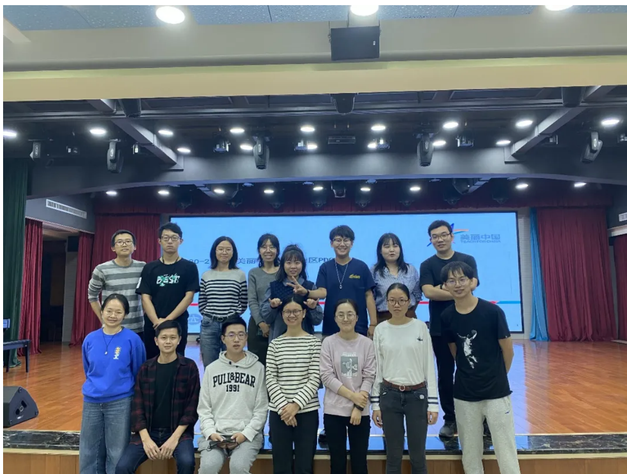
韶关地区项目老师合影