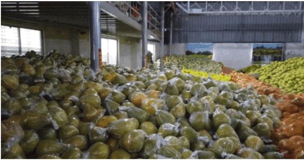
柚子仓库参观现场

本次梅州片区与共青团梅县区委联合举办，上午老师们一同走进千年古镇松口，走进金柚专业村——大黄村。沿着古人的足迹，重走长 2.5 公里、宽 1.8 米的古驿道，感受先辈们下南洋的路径。