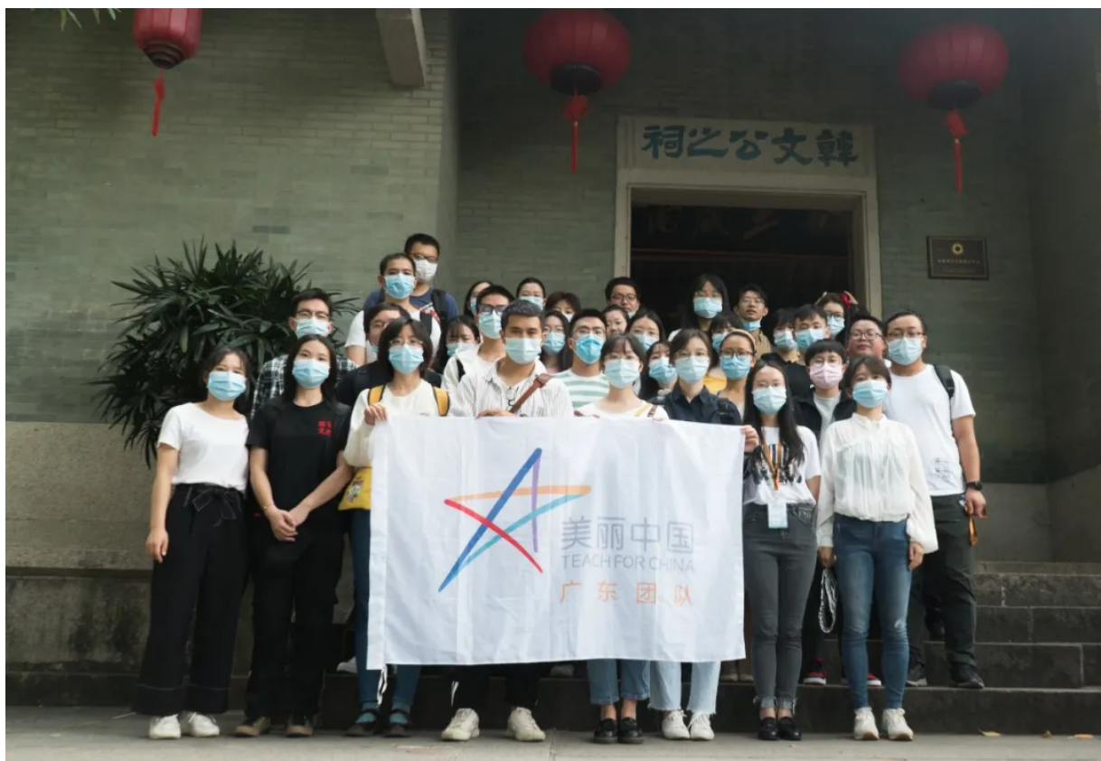
潮州地区的文化探索活动

在团队建设方面，潮州团队举行了乡村生活沙龙、自由茶话会以及世界咖啡屋等活动，为项目老师提供了各抒己见的舞台。在第二天，潮州团队还有一个潮州片区的文化探索活动，增进潮州团队成员之间的认识与交流，增强团队的凝聚力，便于日后团队工作的开展以及教学经验上的互相分享。