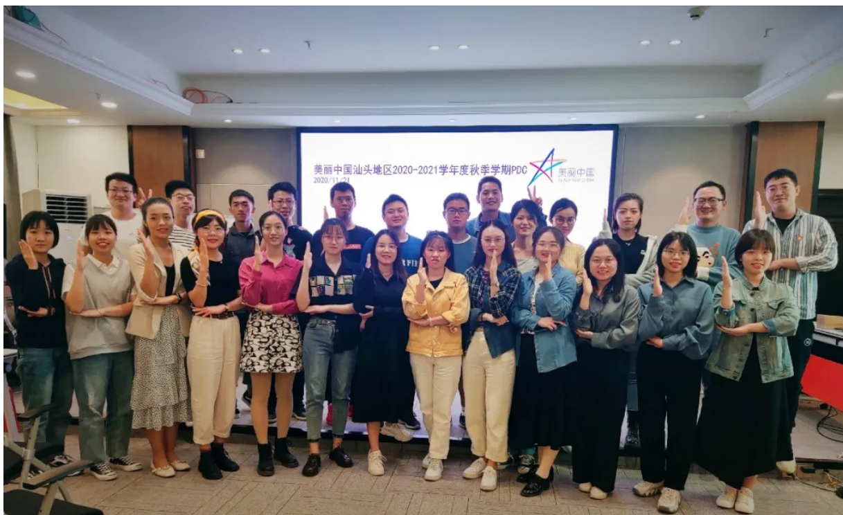
汕头片区项目老师合影