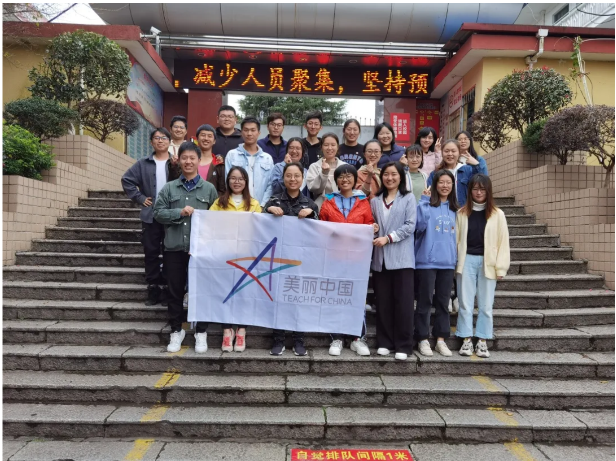
福建三明片区项目老师合影