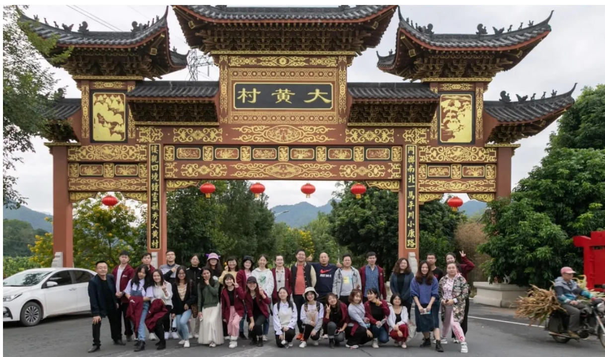
梅州片区项目老师合影