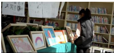
学生在看展—心有猛虎，细嗅蔷薇