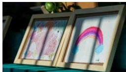
学生作品「大鱼」「彩虹」