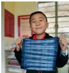
学生“扎染”作品展示