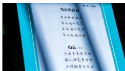
学生诗歌「乌云和白云」