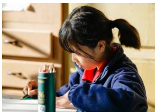
学生在艺术室画画。 借一缕芹香，画一首楚辞苍凉

碧鸡完小位于云南省大理州宾川县拉乌彝族乡碧鸡村，被誉为「国家级生态乡」，拥有着看似贫乏但蕴含着充盈生命力的成长环境。老师们利用这里面对的大山、云雾、朝阳与落日，最原始、最朴素的自然美景来丰富学校近乎495名住校生在校五年的校园生活，以此引导孩子们进行自我发现、表达与创作。