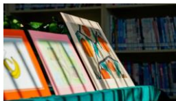
学生作品「柿柿如意」