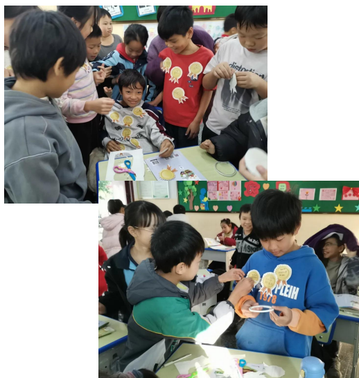
孩子们用手中的徽章为同伴颁奖

在心理课的方寸天地里，她和孩子们共同搭建了一个安全表达、深度觉察的心灵秘密花园。孩子们在这里自由地描绘情绪的模样——“快乐是蹦蹦跳跳，幸福是安静微笑”；他们勇敢地重新解读“错误”，发现它可能带来夜晚的美丽或浇花的学问；他们在校园寻宝中用感官捕捉幸福，在“为你颁奖”中看见并赞美彼此的闪光点。