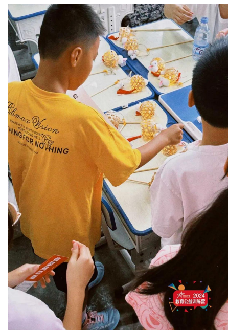
夏令营游园会中，我们与孩子们进行了直接的接触与交流，不同游戏设置以及与孩子们的正面交流也启发了我们的思考。（右图）