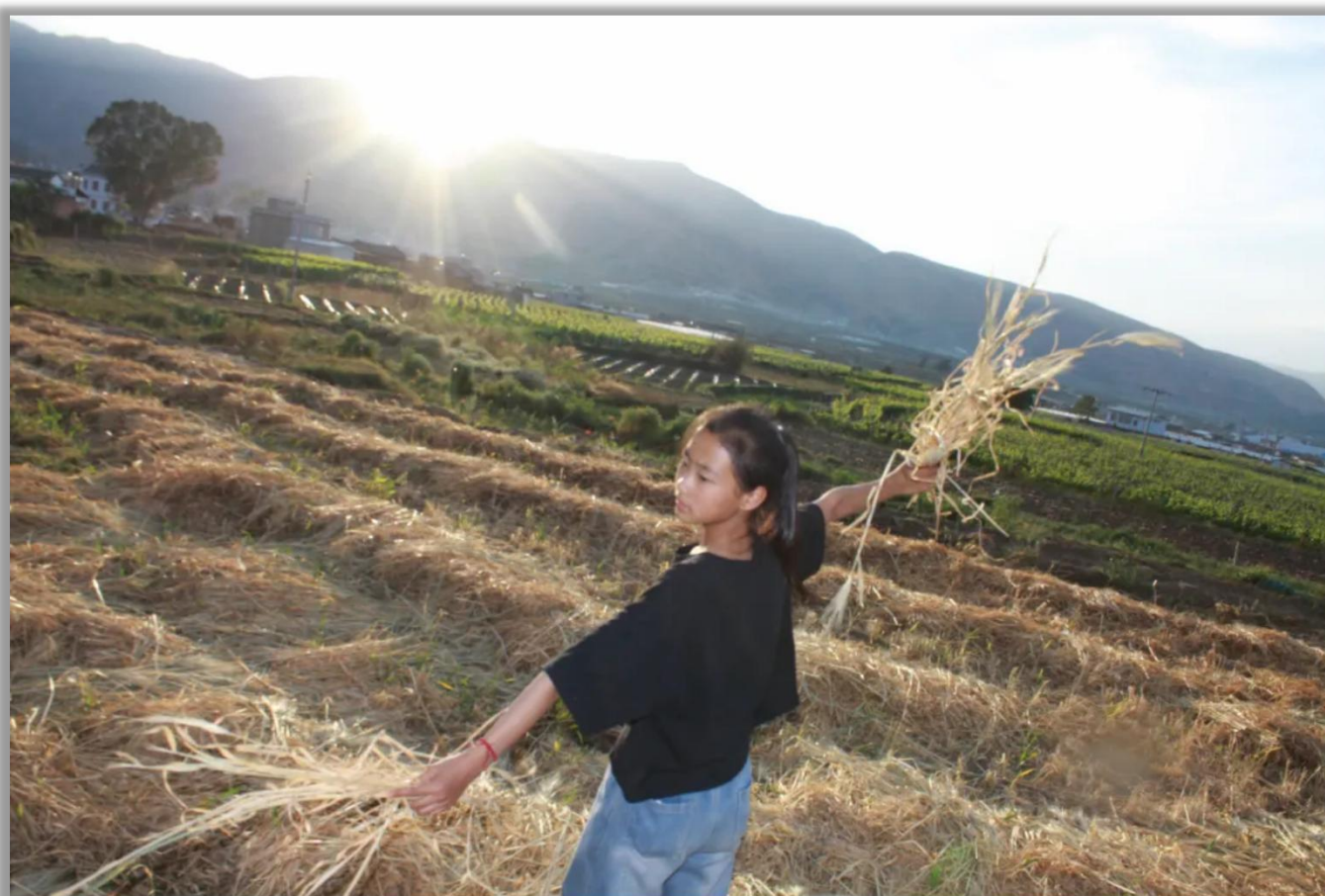
指导教师 / 美丽中国2022级项目老师 胡文欣 王晏雯 云南省大理州宾川县宾居镇华侨农场小学