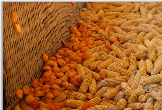
摄影 / 杨洋 指导教师 / 美丽中国2023级项目老师 赵奕 云南省保山市施甸县太平中学