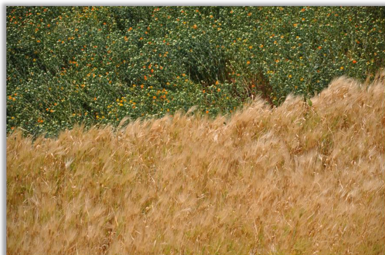
指导教师 / 美丽中国2022级项目老师 毛天怡 云南省大理州南涧县碧溪乡新力小学