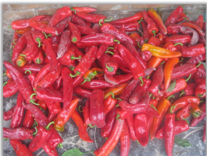
指导教师 / 美丽中国2023级项目老师 江紫轩 甘肃省平凉市静宁县四河镇四河中心小学