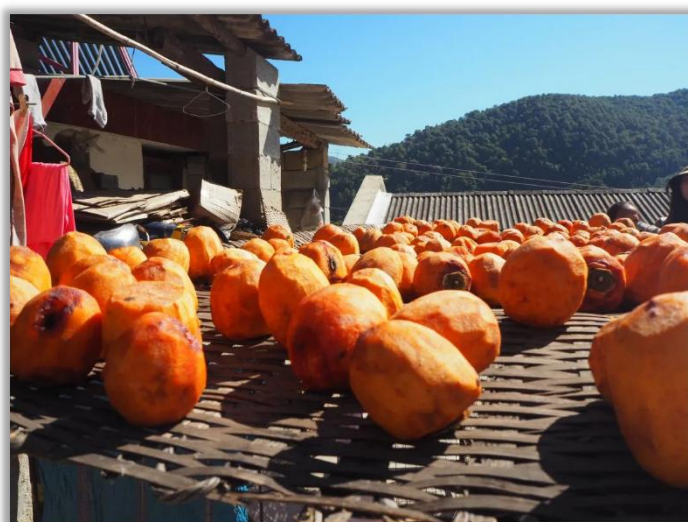
指导教师 / 美丽中国2022级项目老师 胡文欣 云南省双江自治县勐库镇勐库小学