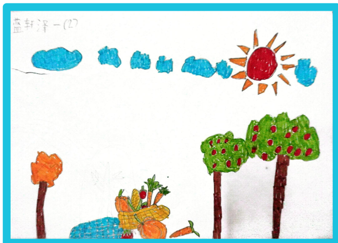
蓝轩泽 马山县白山镇上龙小学 一年级学生