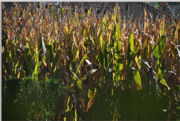
指导教师 / 美丽中国2023级项目老师 江紫轩 甘肃省平凉市静宁县四河镇四河中心小学