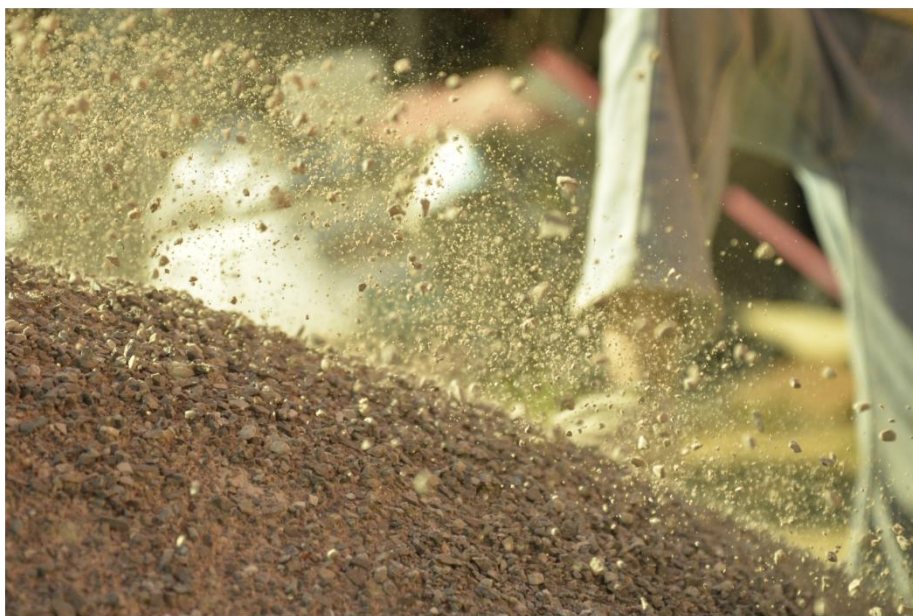
指导教师 / 美丽中国2022级项目老师 杨梦婷 云南省保山市板桥镇沙坝明德小学