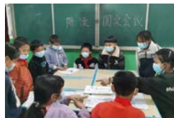
云南楚雄杂腊寄宿小

教室、图书室、走廊、公告栏……在美丽中国项目老师们的策划下，这些笔记也出现在乡村校园的每一个角落。孩子们相互分享读书的感悟经历，学习借鉴其他同学的读书笔记，共同创造共读共享的读书氛围。