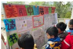
广东韶关大坪小学