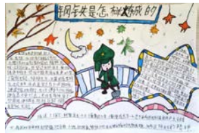
《钢铁是怎样炼成的》