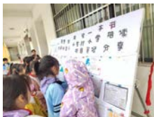
广西百色小龙村小学