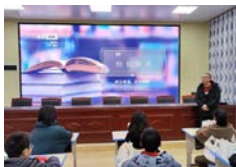
福建三明伊家中心小学