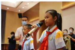
2021年美丽中国暑期学院开幕式