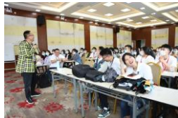
讲师进行教学基础课程分享