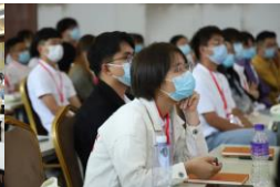
准项目老师认真听讲