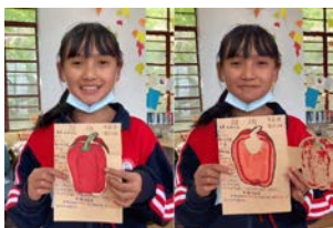
拍摄于云南省大理州南涧县 乐秋乡虎街哨小学

通过阅读活动，孩子们认识了立体书，他们也手痒想要尝试制作立体小卡片。虽然是第一次尝试，但是成果非常让人惊喜，“切开”果蔬，里面竟还别有一番天地！