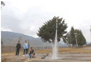
拍摄于云南省大理州南涧县 乐秋乡虎街哨小学

航模社团-水火箭部挑战了二级水火箭。制作过程中，学生们创造性解决问题的能力越来越强。小小的航模承载着孩子们对于航天科技、对于浩瀚宇宙的探索热情，飞上蓝天。