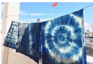
拍摄于云南省大理州巍山县 五印乡蒙新小学

师：图书室这些柜子，我们怎么给它遮一下呢？ 生：扎染！走起！ 就这样，巍山彝族的扎染成为了图书室的软装。云南的蓝天配上扎染作品，绝了！