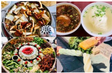
图：项目老师拍摄的巍山美食图集

除去教学任务，除去每天面对的学生、电脑、教室，支教还有哪些美好值得被记录，让我们一起来看一看云南部分项目学校的「风景名胜」~