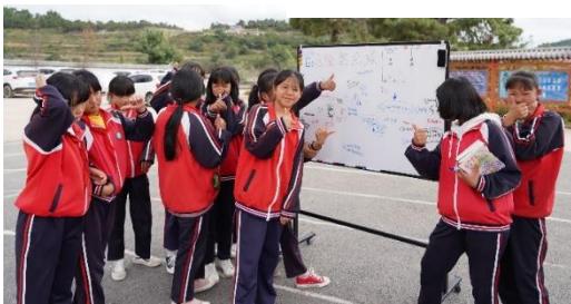
图 / 女孩加油 大理南涧龙凤小学