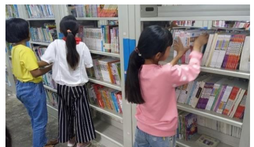
图 / 坝子上的阅读宝库 临沧双江勐库镇完小、忙那完小