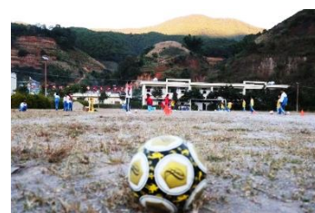
图 / 腊东足球队 临沧临翔区腊东完小 岳阳 摄