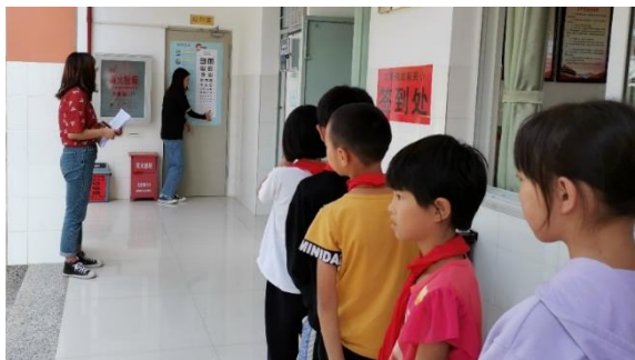
图 / 为学生检测视力 大理宾川 王天美 摄