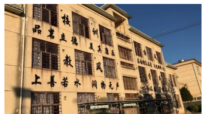
图 / 周姝君老师访校大理宾川力角完小所见