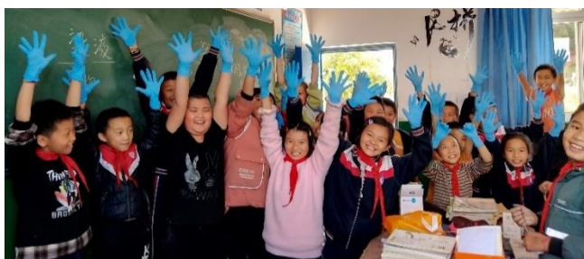
图 / 举起你们的小蓝手 大理巍山