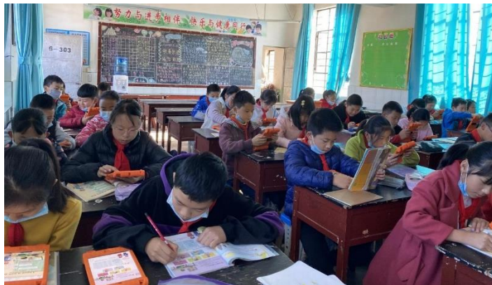
图 / Ipad让英语课锦上添花

为增强教学的交互性，为学生的创新、视野、思维开拓空间，可以让英语课堂真正“动”起来，“活”起来。金碧小学六年级学生的英语课堂上出现了学习新伙伴——IPad。利用IPad的英语学习软件进行预习，让学生进行对话练习，从被动学习变为主动学习，他们的学习积极性更高了。