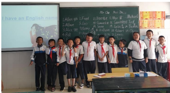
图 / 我有英文名字啦！ 新川完小 大理宾川