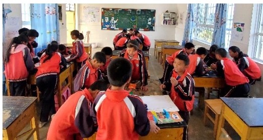
图 / 拥翠乡龙凤小学成长故事课 大理南涧