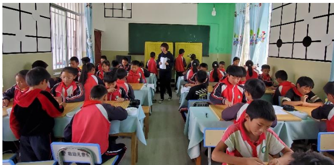
图 / 龙凤小学 学生在下围棋 大理南涧