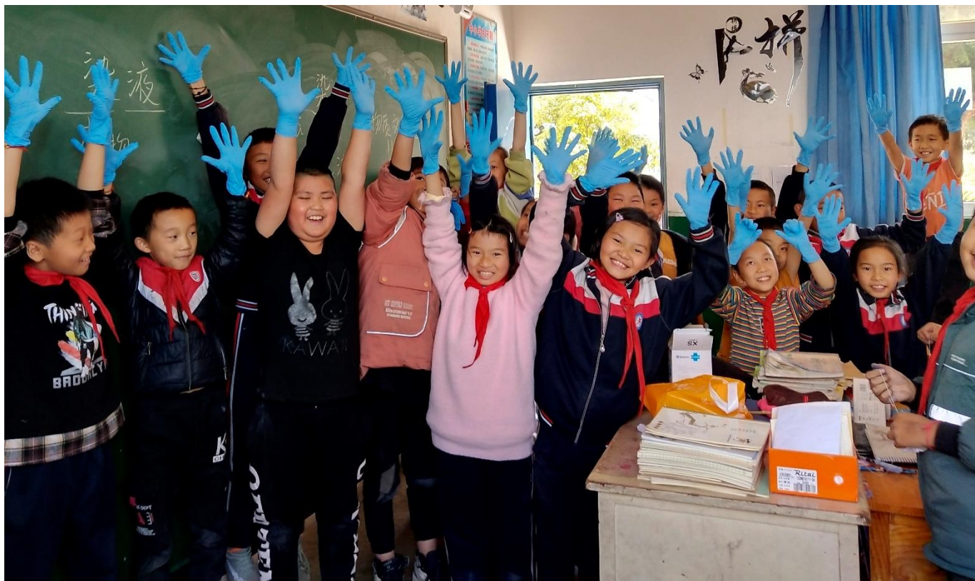
大理巍山小河小学七庄分校 举起你们的小蓝手