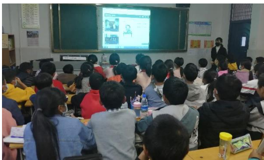
图 / 龙街小学双师课堂 大理巍山

11月，龙街小学的“三村晖”双师课堂顺利开展。本月的第四周，在英语课上，志愿者给四五年级的同学们介绍了中西方文化的差异，教授了新单词以及感叹句的用法；在科学课上，志愿者们用一个个神奇的小实验，让同学们了解了水的几种状态，逐步感受水的奥秘。线上小老师们生动的讲解极大地提高了同学们学习的兴趣，特别是与水有关的几个简单的实验，不少同学表示，回家要亲手试一试。通过线上与线下的有机结合，科技素养课堂越来越有趣，同学们学习的积极性也越来越高。