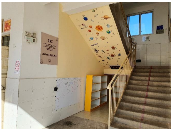
图 / 转角书屋 拥翠乡龙凤小学 大理南涧