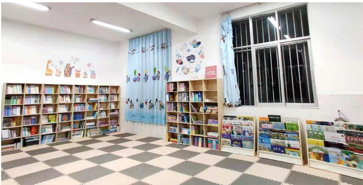
图 / 拥翠小学阅览室“升级”完成大理南涧拥翠