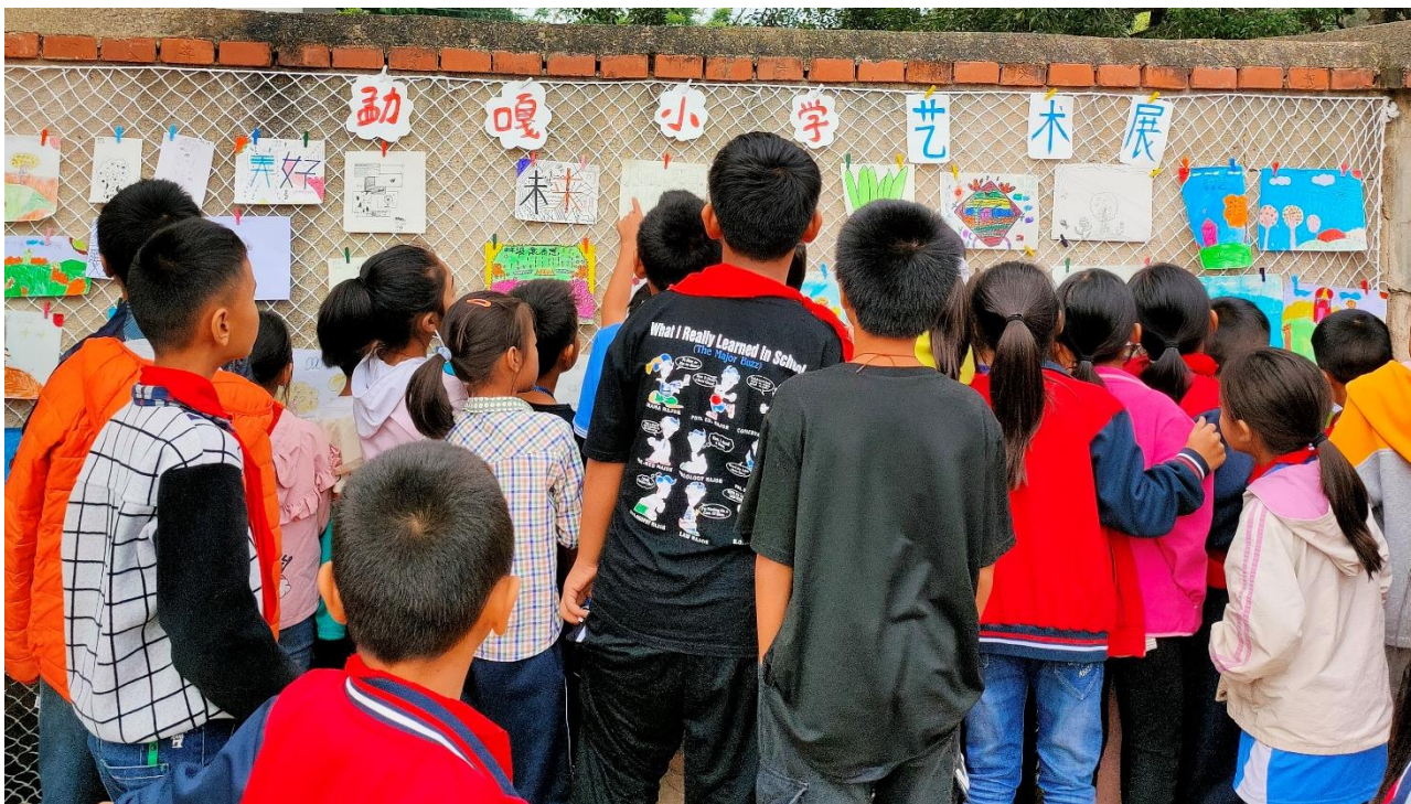
图 / 艺术展正式对外营业 勐嘎小学