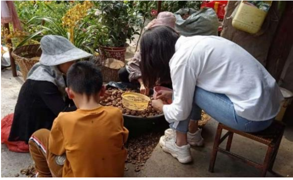
图 / 厂街乡中心完小家访 大理永平 沈先艳 摄