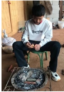
图 / 学生用玉米杆子生火 大理鹤庆黄坪中学