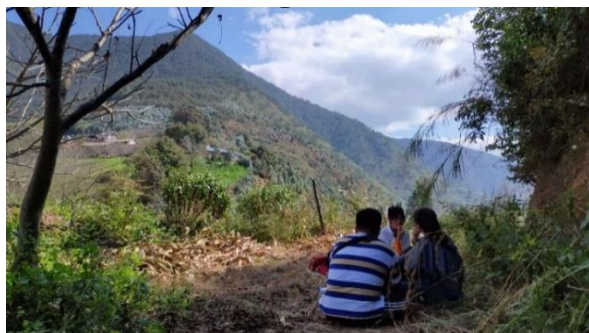
图 / 背山阴处好野餐 大理永平水泄中学 刘若谷 摄