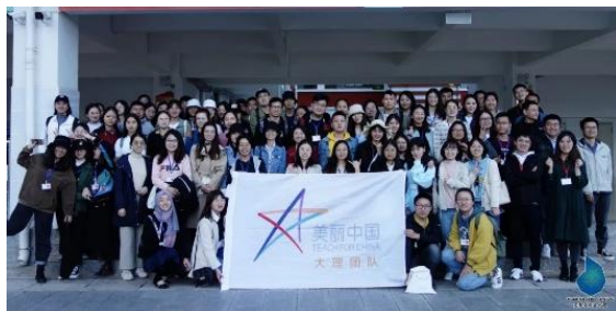
图 / 大理团队