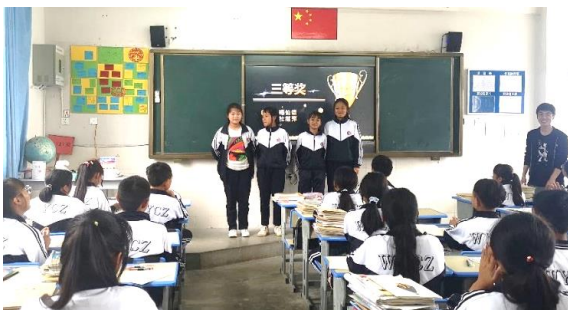
图 / 颁奖典礼 临沧云县万佑中学 龙玉雪 摄

每位上台的同学都收获了笔记本、填涂笔等奖励，还有老师亲笔写下的鼓励卡。最后，老师和同学们约定下一轮的学习生活已经开始，下次的颁奖典礼会对小组合作表现好的有特别奖励。这次颁奖典礼中，老师和同学们收获感动与惊喜，并对下一次颁奖典礼的到来充满了期待。