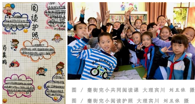
图 / 蹇街完小共同阅读课 大理宾川