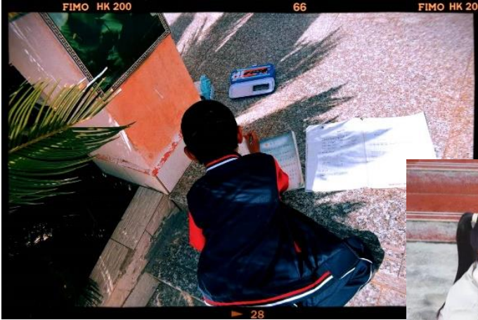
图 / 孩子们的日常 大理宾川拉乌完小 王李君 摄 图 / 女孩们洗衣服 大理宾川拉乌完小 王李君 摄