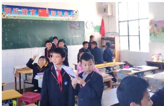
图 / 背诵大赛-大理巍山白池小学 胡西春 摄

本月中旬，针对班里许多同学乘除法运算不熟练的情况，胡西春老师举办了一次乘法口诀背诵大赛。班上的同学分为五个小组展开竞赛，共有五轮，依次为：乘法口诀竞速背诵、倒背口诀、给积说因数、整十数整百数乘法、整十数整百数除法。每轮前三小组获得积分，五轮下来根据累计积分决出冠亚军季军。本次活动一方面是想帮助学生锻炼运算能力，另一方面也想让学生体会到学习并不只是一件枯燥的事，也可以有多种有趣的形式。