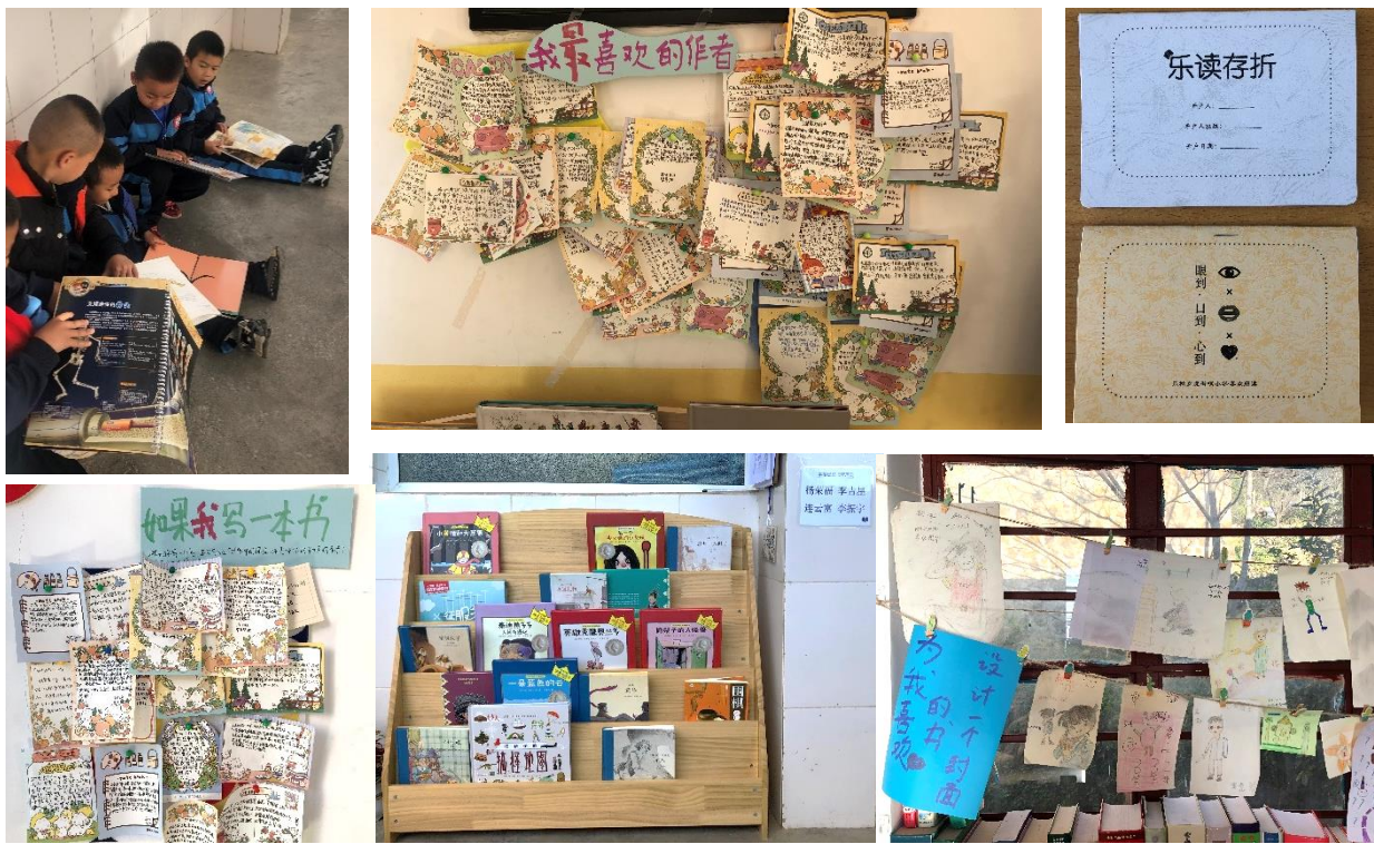
图 / 秋乡虎街哨小学图书站&amp;阅读分享活动