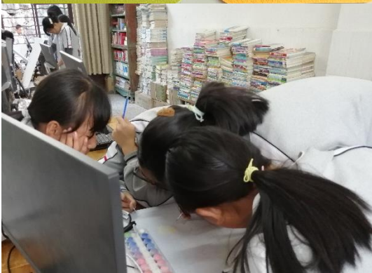
图 / 大文图书室改造 临沧临翔区大文中学

很多学生也以图书管理员的身份也参与图书室文化共建中，目前图书管理员每人在图书室栽培了一颗属于自己的多肉植物盆栽，图书室的墙上还有图书管理员创作的“小王子”读后分享。此外，图书室还新增了阅读书目推荐板块，并每周进行更新，为同学们实时分享一些优秀书籍。