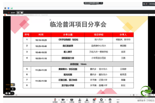
图 / 临普团队