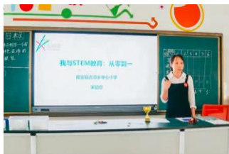
当地老师主动与大家分享自己的课例和收获