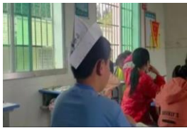
用英语试卷卷折帽子